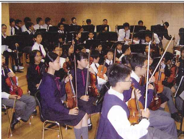
现代香港某中学音乐活动室

鉴于国际顾问团的意见，政府从节约财政支出的角度提出了“直接资助计划”。直资学校在获得同等规模的津贴学校的补贴外还可以收取一定学费。这项政策的主要目的是希望节约政府出资建新学校替代私立学校的成本，通过把原来的买位私校改成直资学校，提高资助标准，同时允许其收费来加快发展建设，缩小与官立学校和津贴学校的差距。另外，政府希望协助私立学校发展成为一个强大的体系，在官立和津贴学校教育以外提供另类的优质学校，使家长为子女选择学校时有更多选择。参加计划的学校将获得充分的自由订立符合基本教育标准的课程、学费及入学资格。政策规定除了官立学校外，香港的私立学校